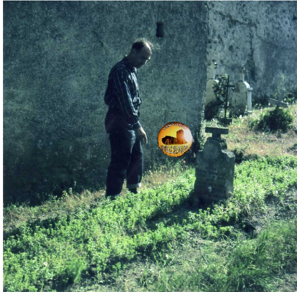
Noël Corbu en 1962 montrant la tombe de Barthélémy Rivière

Depuis les années soixante, une des tombes dans le cimetière de Rennes-le-Château qui suscite le plus d'interrogations de la part des chercheurs est celle qui se trouve près du clocher où Barthélémy Rivière fut inhumé en 1896.